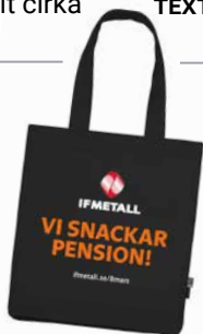
Tygkasse, artikelnummer IF446.