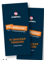
Folder, artikelnummer AA-803.