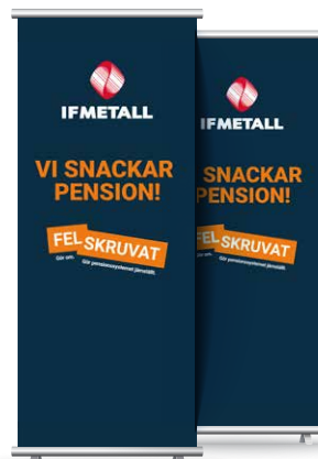
Roll up, artikelnummer IF447.