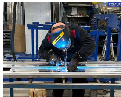
Montering av ugnar på Revent med svets.